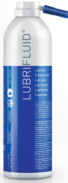
LUBRIFLUID Schmiermittel 500 ml VPE zu 6 Flaschen REF. 1600064-006