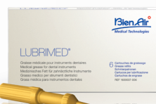
LUBRIMED VPE zu 6 Patronen REF. 1600037-006