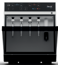
LUBRICARE 2 Pfleegerät REF. 1601156-001