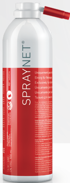
SPRAYNET Reinigungsspray 500 ml VPE zu 6 Flaschen REF. 1600036-006