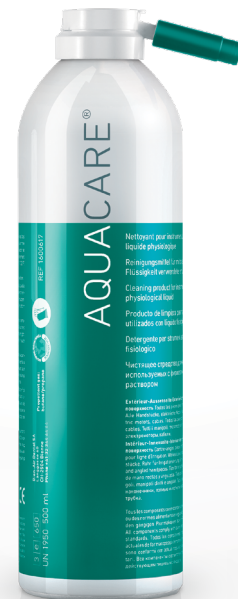
AQUACARE Reinigungsspray 500 ml VPE zu 6 Flaschen REF. 1600617-006