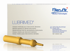
LUBRIMED Embalagem de 6 aplicadores REF. 1600037-006