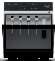
LUBRICARE 2 Sistema de manutenção REF. 1601156-001