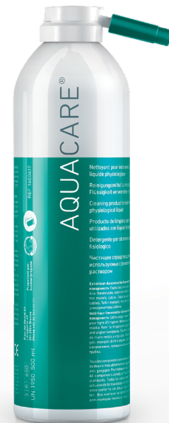
AQUACARE 500 ml spray de limpeza Embalagem de 6 unidades REF. 1600617-006