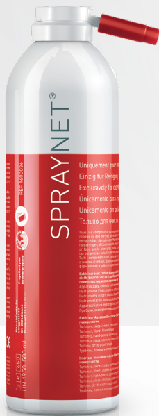
SPRAYNET 500 ml spray de limpeza Embalagem de 6 unidades REF. 1600036-006