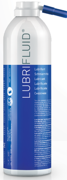
LUBRIFLUID 500 ml lubrificante Embalagem de 6 unidades REF. 1600064-006