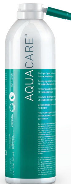
防锈喷雾剂 (AQUACARE) 500 ml 每箱 6 瓶 产品编号 1600617-006