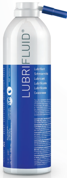
润滑喷雾剂 (LUBRIFLUID) 500 ml 每箱 6 瓶 产品编号 1600064-006