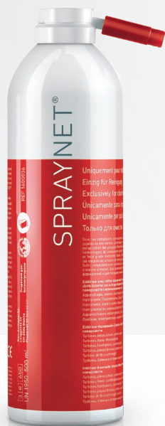
清洁喷雾剂 (SPRAYNET) 500 ml 每箱 6 瓶 产品编号 1600036-006