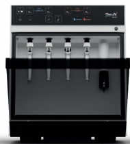
LUBRICARE 2 清洗注油机 产品编号 1601156-001