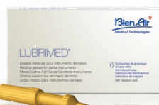
润滑脂 (LUBRIMED) 一包 6 支 产品编号 1600037-006