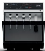
LUBRICARE 2 Sistema de manutenção REF. 1601156-001