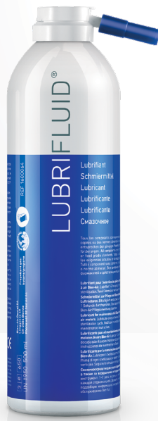
LUBRIFLUID 500 ml lubrificante Embalagem de 6 unidades REF. 1600064-006