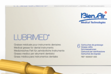
LUBRIMED Embalagem de 6 aplicadores REF. 1600037-006