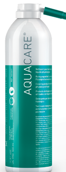
AQUACARE 500 ml spray de limpeza Embalagem de 6 unidades REF. 1600067-006