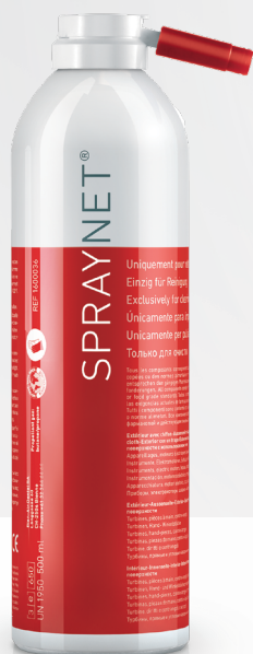
SPRAYNET 500 ml spray de limpeza Embalagem de 6 unidades REF. 1600036-006