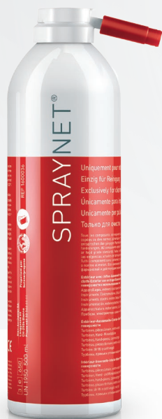
清洁喷雾剂 (SPRAYNET) 500 ml