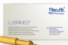
润滑脂 (LUBRIMED) 一包 6 支 产品编号 1600037-006