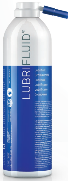
润滑喷雾剂 (LUBRIFLUID) 500 ml