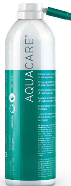
防锈喷雾剂 500 ml